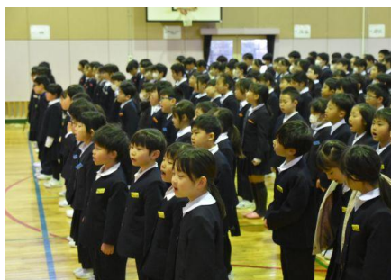
始業式：校歌合唱の様子

3学期は、一年間のまとめをする学期です。子供たち一人一人がそれぞれにまとめをしっかりと、進学や進級の準備を整えることができるように、教職員一同でしっかりと支えていきたいと思えます。保護者の皆様には、子供たちのさらなる成長のために、今年もご協力を賜りますよう、よろしくお願いいたします。