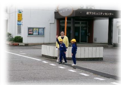
交通安全教室(1・2年生歩行)