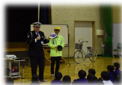
交通安全教室(安全指導)